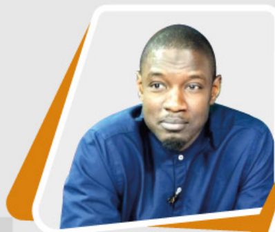
Pape Djibril FALL Journaliste - chroniqueur